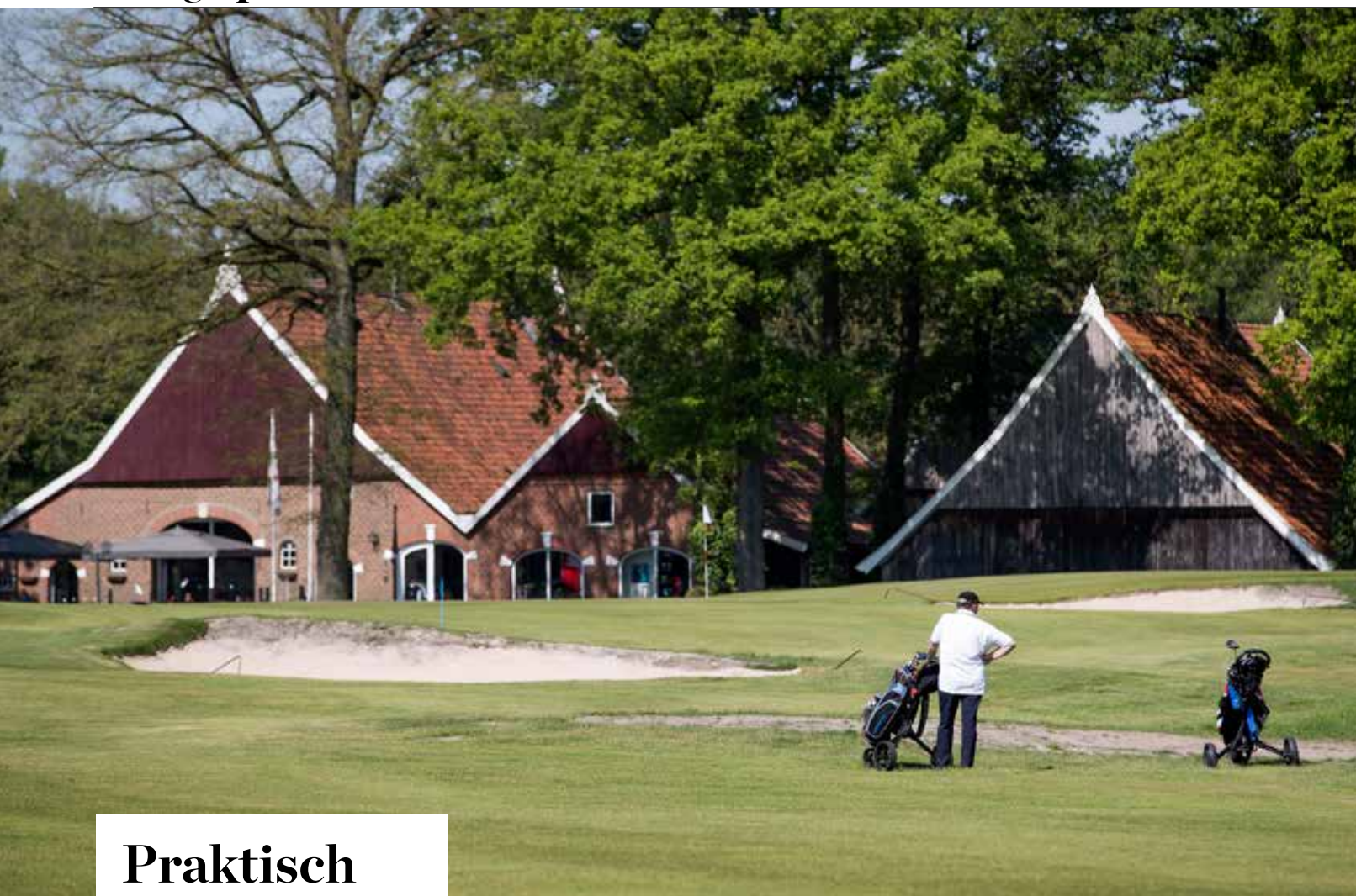
► FOTO LINKS: DE ACHTTIENDE EINDIGT PAL VOOR DE TOT CLUBHUIS OMGEBOUWDE OUDE BOERDERIJ.