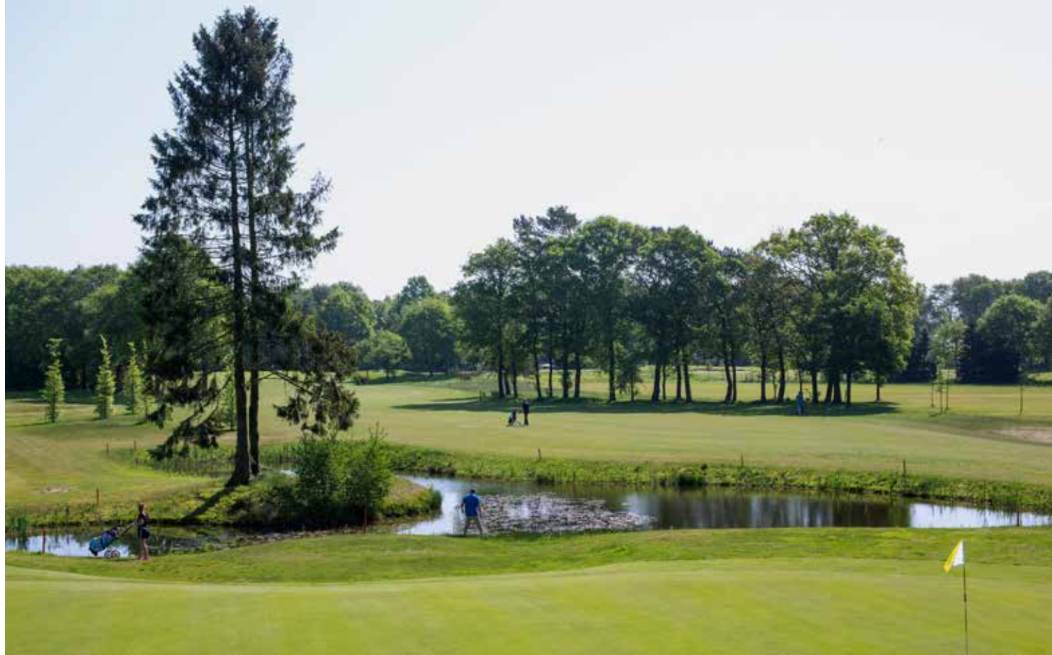
► FOTO LINKS: HIER EN DAAR ZIT DE BAAN KRAMP IN ZIJN JASJE EN LIGGEN DE HOLES WAT DICHT OP ELKAAR.

bochten te komen zonder dat het – door onbekendheid, bomen en water – ook maar in ons opkwam in twee slagen naar de green te gaan. Ook hier geldt: dat moet op te lossen zijn.