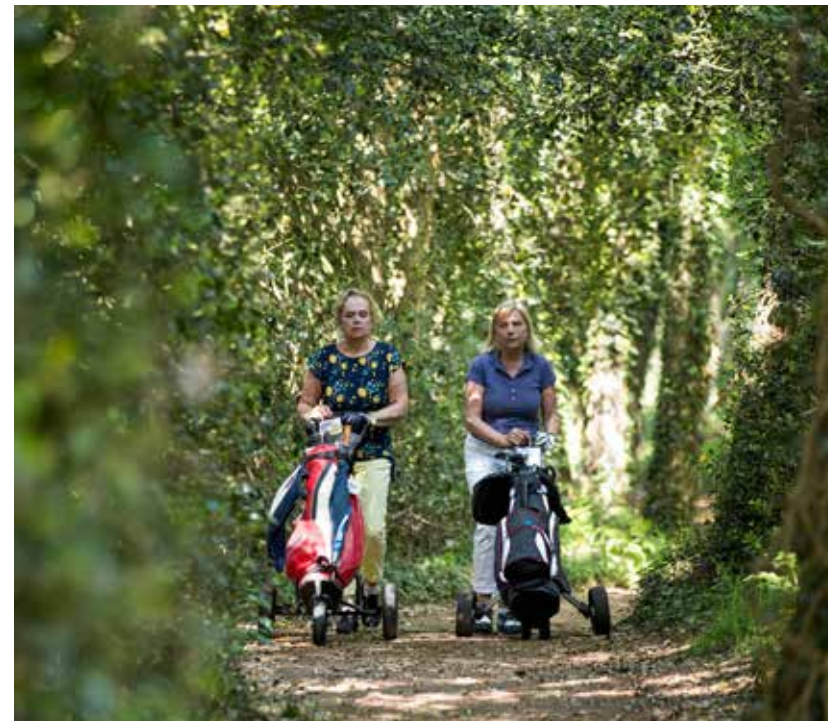
► BOSWANDELING OP WEG NAAR DE VOLGENDE HOLE.

Er is gelukkig meer dan genoeg waar de meester zo een dikke krul onder zou zetten. Een leuke afwisseling tussen korte (129 meter) en lange (185 meter) par-3's. Par-4 holes waarbij je wellicht in de verleiding komt de green aan te vallen (hole een en zestien) tegenover holes waar clubkeuze van de tee allesbepalend is (hole drie, zes en twaalf). Holes in de beschutting van de bomen tegenover holes in het open terrein. Goed onderhouden greens, prima bunkers, spannende rough en – tijdens ons bezoek – door droogte mooi geel wordende fairways. Met een paar aanpassingen zou Winterswijk de baan significant kunnen verbeteren. We hopen dat dit ook gaat gebeuren, want oh, wat is het fijn toeven daar diep in de Achterhoek, waar je niets hoort, behalve de droge tik van een golfbal en het zacht ruisen van de bomen. 📍