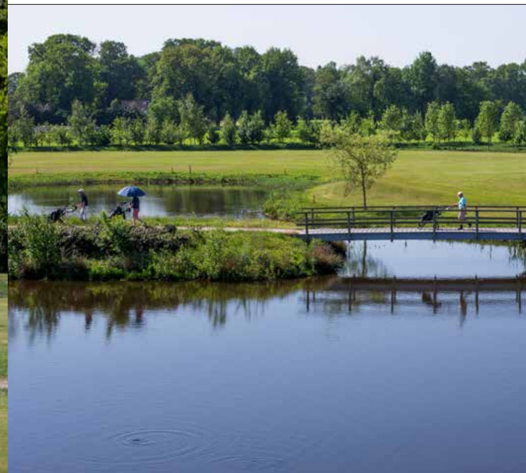
► HOLE TIEN, EEN PAR-5 DIE JE KUNT SPELEN MET EEN RESCUE, EEN IJZER-9 EN EEN WEDGE...